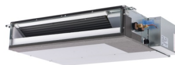
Extra plat SEZ - KD ... VAQ BASSE PRESSION