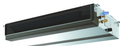
PEAD - RP ... JAQ MOYENNE PRESSION

Pour gainables types : | SEZ - M DA | SEZ - KD VAQ | DRV PEFY - P_VMS 1E |