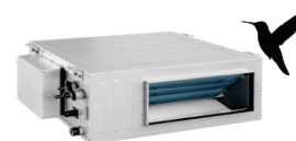
GREE - FM CDT ...