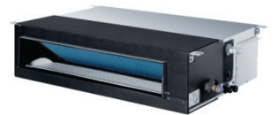
40 VD ... S – 7S

Gamme standard VRF « XCT 7 » MOYENNE PRESSION