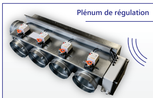
Plénum de régulation