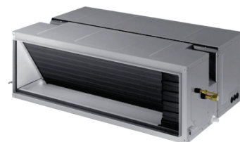
AC 200/250 KNHPKH AM 180 JNHFKH HAUTE PRESSION