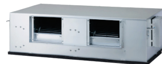
UB 70 & 85 N94 HAUTE PRESSION