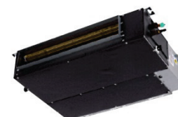
CL5000iU/iL D ... E (mono et multisplit)