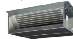
FWD ... VENTILO-CONVECTEUR