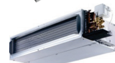
42 NH VENTILO-CONVECTEUR