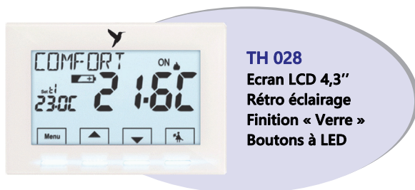
TH 028 Ecran LCD 4,3" Rétro éclairage Finition « Verre » Boutons à LED