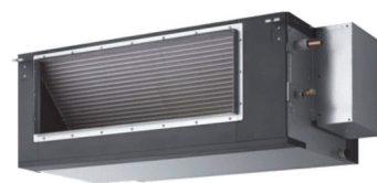
S - ... PE3E5B HAUTE PRESSION