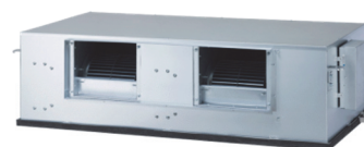
UB 70 & 85 N94 HAUTE PRESSION