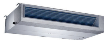
AARIA AMD ...