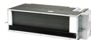
CS - Z ... UD3EA (25 à 60) BASSE PRESSION