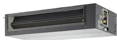
S - ... PF1E5B (36 à 140) MOYENNE PRESSION

Pour gainables types : | CS - Z .. UD3EA (multi-split & mono-split) | S - .. MM1E5A (gamme DRV) |