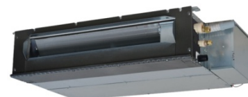
SRR 25 / 35 / 50 / 60