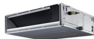
UGE 25 / 35 / 50 BASSE PRESSION