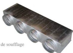
Plénum de soufflage