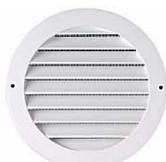
MODELE : CXT