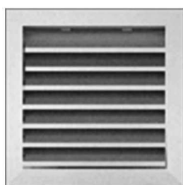
MODELE : GREX / T