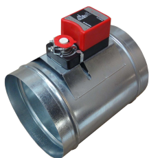
Modèle : RM2