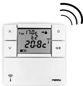
Thermostat radio TH TETX 04