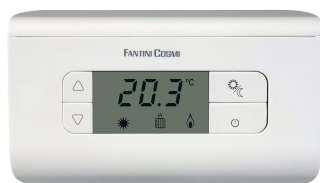
Thermostat TH 115

Fonction : Sélection HIVER / ETE, Réduction nocturne, Position hors-gel, On/Off. Amplitude de réglage des températures : de 2°C à 40°C Large afficheur LCD ( 52 x 28 mm ) et touches de réglages plus grandes que le modèle TH110.