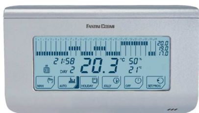
Thermostat TH 150 TS

Fonction : Sélection HIVER / ETE, Réduction nocturne, Position hors-gel, On/Off. Programmation HEBDOMADAIRE et JOURNALIERE Sélection courbe de température sur 24 h et sur 7j. Transmetteur téléphonique avec modem GSM, pour le contrôle à distance à travers des messages SMS. Interrogation à distance, gestion des modes de fonctionnement, ... Amplitude de réglage des températures : de 2°C à 40°C Large AFFICHEUR TACTILE, de 108 x 44 mm, avec rétro éclairage de l'écran.