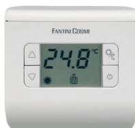
Thermostat TH 110

Fonction : Sélection HIVER / ETE, Réduction nocturne, Position hors-gel, On/Off. Amplitude de réglage des températures : de 2°C à 40°C