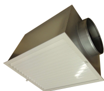
1 ou 2 Piquages suivant demande

Pack comprenant : Grille de reprise + filtre + plénum isolé, avec piquage opposé