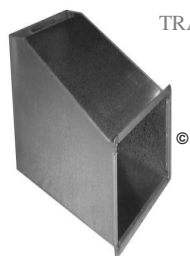
PIECE DE TRANSFORMATION