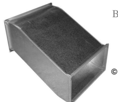
BAÏONNETTE ou : DEVOIEMENT

ATTENTION : élément de fabrication spéciale, ne peut être modifié après fabrication .