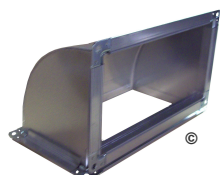
COUDE à 90° VERTICAL

Réf : COUDE 90V ... x ... ( Réf suivie de la section )